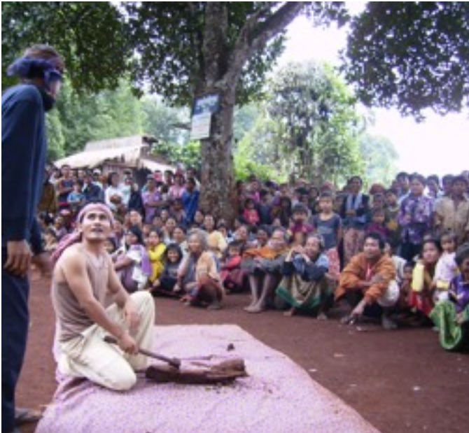
Nomad's theater shows in the villages

We hope to see you there and bring your friends and family!